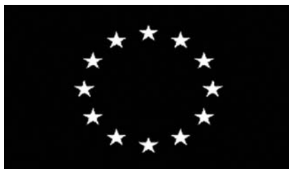
Slika 1. Prepoznatljivo obeležje Evropske unije 3

Evropska unija je jedna od najmoćnijih ekonomskih integracija u svetu koja ima stabilan položaj na globalnoj ekonomskoj sceni i veoma zavidan ugled. Postoje različite i mnogobrojne definicije, mada se uglavnom sve svode na jedinstven stav da Evropska unija funkcioniše kao: 4